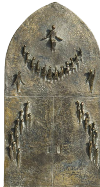
Ulrich Henn (1925–2014) Modell Bronze-Portal St. Martin, Kassel, 1965 50 × 25 cm