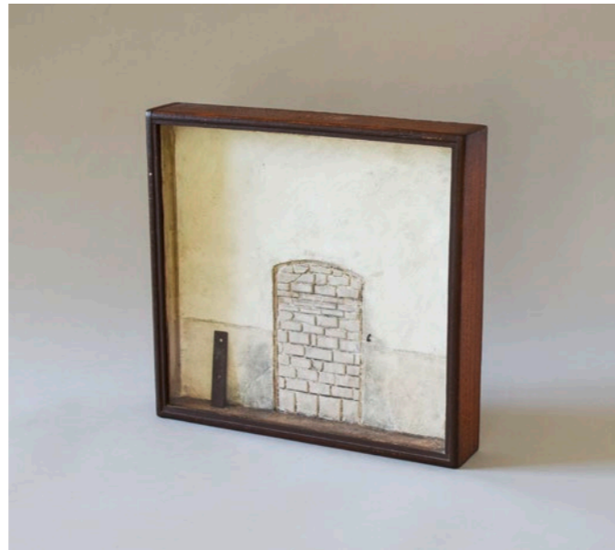
Michael Sauer (*1949) Eingang , 1974 Mischtechnik (Gips, Eisen, Holz, Glas) Objektkasten 33,8 × 6,2 × 35,4 cm rückseitig betitelt, signiert und datiert