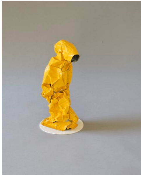
Sara F. Levin (*1963) Magdalena , 2012, Reflektorband / Aluminium Höhe 25 cm