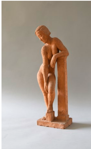
Jakob Wilhelm Fehrle (1884–1974) Ohne Titel , 1927 Terracotta Höhe 67 cm