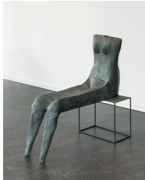
Lothar Fischer (1933–2004) Große Sitzende auf Gestell , 1983 Bronze 95 × 45 × 105 cm WVZ Nr. 1163