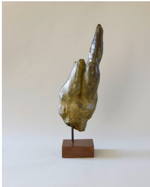
Frederique Edy (*1967) Idole , 2000 Bronze, Exemplar 3/8 Höhe 60 cm