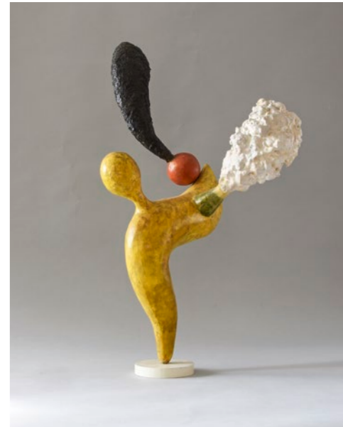
Günter Reichenbach (*1955) hinweg versetzt (P70) , 1992 Epoxid / Glasfaser, Pigmente 72 × 42 × 32 cm