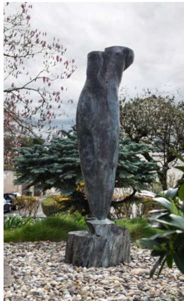
Gerold Jäggle (*1961) Studie , 2014 Bronze, Unikat 158 × 60 × 48 cm