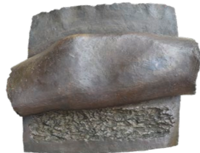
Wilhelm Loth (1920–1993) Verbergung, Studie 42/64 (Relief), 1964/65 Bronze 34 × 42 × 9 cm WVZ Nr. 91