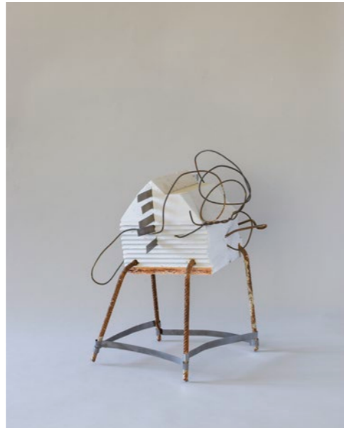
Sara F. Levin (*1963) Ohne Titel , 2017, Stahl, Polystyrol, Acryl, Draht Höhe 48 cm