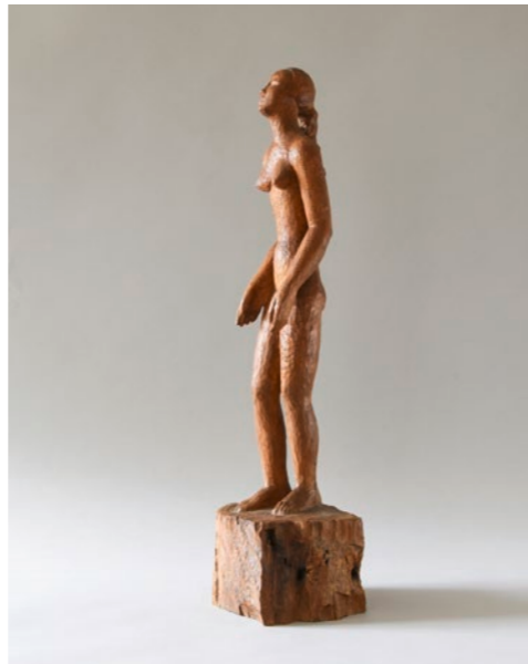
Jakob Wilhelm Fehrle (1884–1974) Ohne Titel, um 1920 Eiche Höhe 65 cm