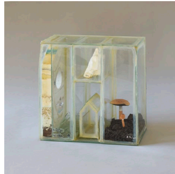
Clemens Weiss (*1955) New York Box , 1997 Nr. 52/290 30 × 30 × 12 cm Gemeinschaftsarbeit mit Emil Lukas (*1964), Lawrence Carroll (*1954) und Roxy Paine (*1966): Glasobjekt des Künstlers, Glas- streifen und -bruchstücke mit Leim zu einem Vitrinenobjekt montiert, darin eingefügt ein signiertes Gipselement (Emil Lukas), Gips- abdruck einiger Finger (Lawrence Carroll) und ein Ensemble aus Blumenerde und Pilzen (Roxy Paine) sowie weitere Objekte des Künstlers Clemens Weiss (Bruch- glas und ein Miniatur-Glashaus), von diesem außen unten signiert, datiert und bezeichnet.