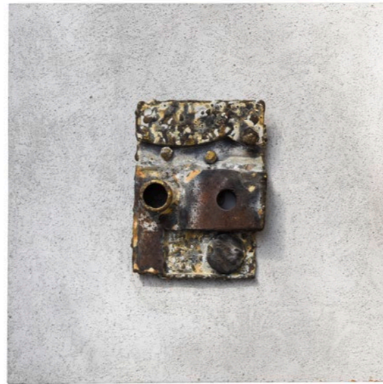
Horst Kuhnert (*1939) Ohne Titel, um 1960/1963 Assemblage (Eisen) auf grundierter und grau strukturierter Hartfaserplatte Eisenskulptur: 18,5 × 14 × 4,7 cm Hartfaserplatte: 40 × 40 × 7 cm