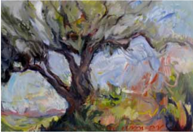
Picnique , 2013, Öl auf Leinwand, 114 x 162 cm