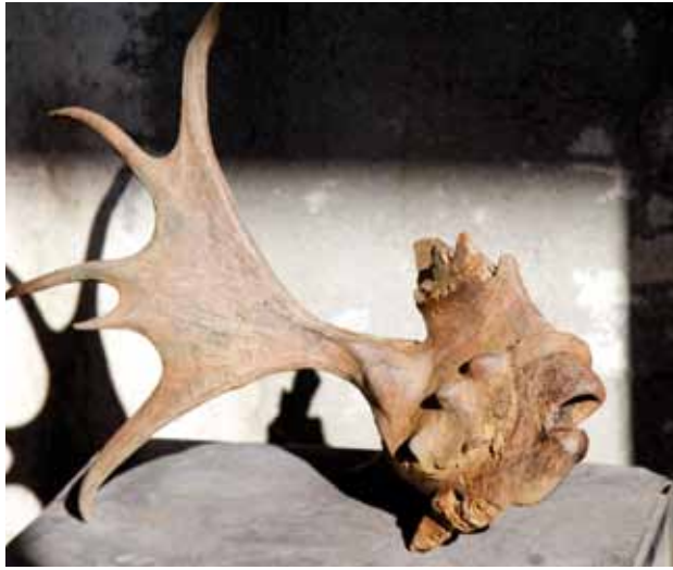
Ohne Titel, 2012, Bronze, 43 x 64 x 74 cm