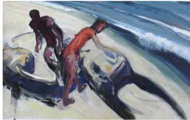
Jeux à la plage , 2012, Öl auf Leinwand, 89 x 145 cm