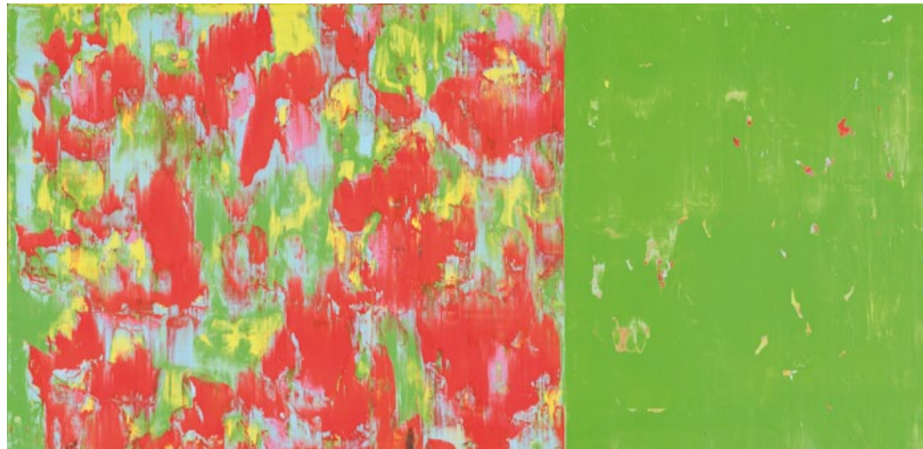
Oliver Christmann, ohne Titel, D5, 2013, Acryl auf Leinwand, 70 x 140 cm

Arbeiten von Oliver Christmann befinden sind in zahlreichen öffentlichen Sammlungen.