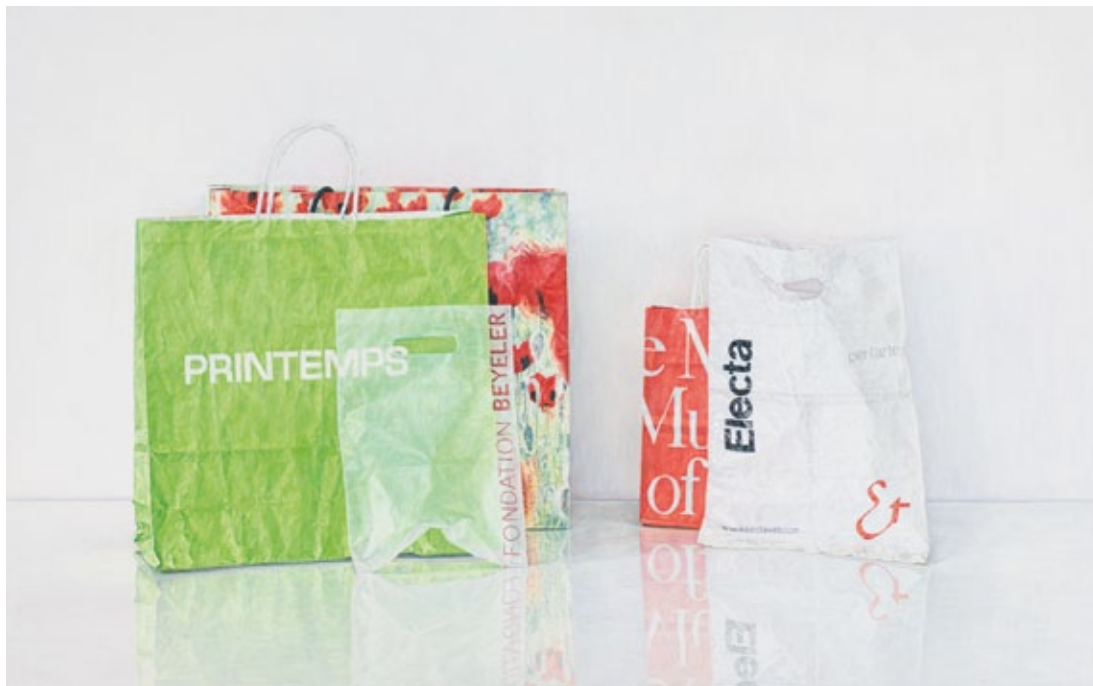
Sabine Christmann Printemps/Mohn , 2013, Öl auf Leinwand, 90 x 140 cm